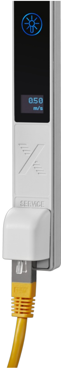
SERVICE SOCKET FOR CONTROLLER CONFIGURATION