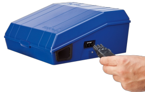
CONNECTION SOCKET FOR LIGHTING