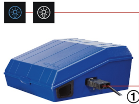
BUTTONS ON THE CONTROL PANEL TO SWITCH THE LIGHTING ON/OFF