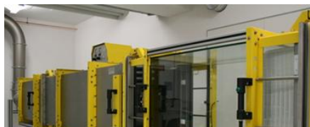
A NAIVIŠF ZAHTIFVF