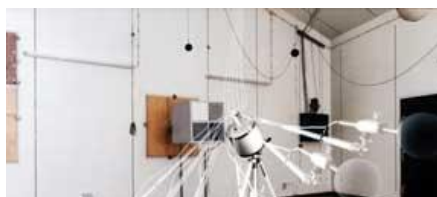
JERENJA NA PRIGUŠIVAČIMA VUKA KUSTIKA