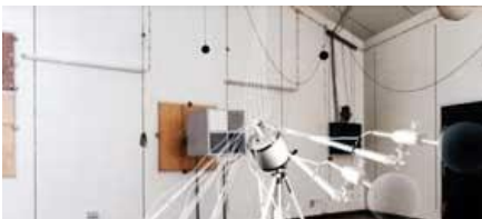
JERENJA NA PRIGUŠIVAČIMA VUKA KUSTIKA